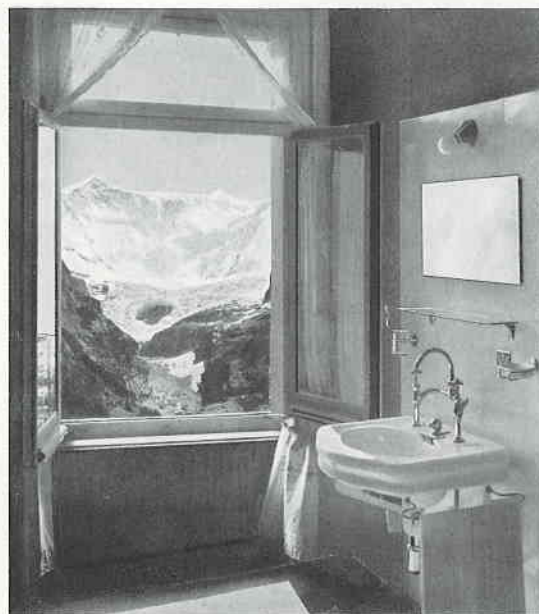
Oeffne Dein Fenster, es grüssen die Berge!