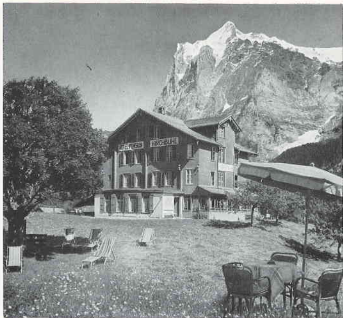
Im «Kirchbühl» frei von Lärm und Hast, zunächst dem Dorfe nehm' ich Rast

The Hotel Pension Kirchbühl is a modest house built in chalet-style. Its situation is elevated, quiet and free from dust amidst flower-covered meadows. Large airy rooms fitted with running water afford an impressive view of the glaciers and the lesser peaks of the valley. Excellent cuisine and choice wines. Our own rural economy. Unnumbered pleasant walks, excursions and mountain tours. The house lies above the (valley) station of the Chairlift Grindelwald-First and offers therefore a special advantage for winter sports enthusiasts.